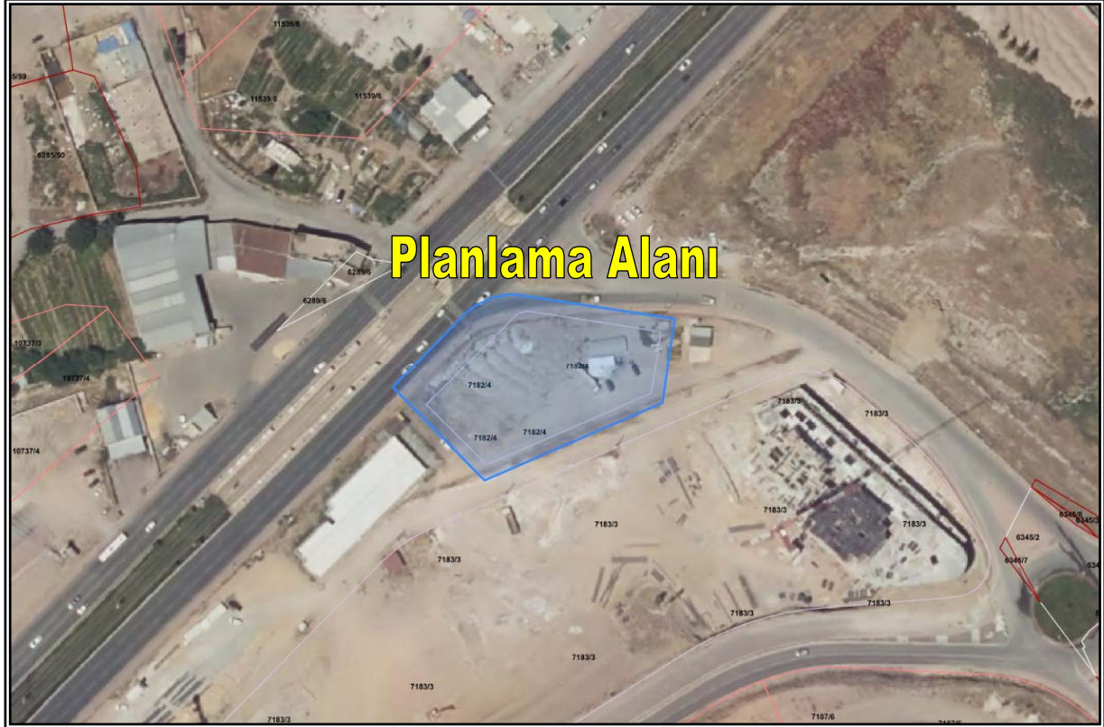
Resim 3: Planlama Alanı Mülkiyet Durumu

Planlama alanı; tapuda Kocasinan İlçesi, Ahi Evran Mahallesi sınırları içerisinde, mülkiyeti Kocasinan Belediyesi'ne ait 7182 ada 4 parsel numaralı taşınmaz üzerinde yer almaktadır. (Bkz. Resim 3)