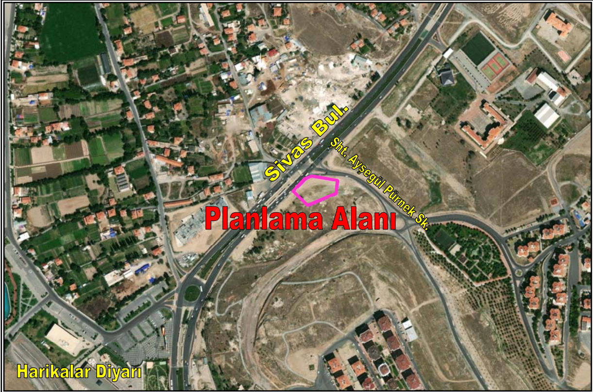
Resim 1: Planlama Alanının Konumu

Planlama alanı; düz bir arazi yapısına sahiptir. Bahse konu alan üzerinde herhangi bir yapılaşma görülmemiş olup boş arazi statüsündedir. Planlama alanının yakın çevresinde ise 10-12 katlı konut ve işyeri kullanımlı inşaat halinde yapılar, işyerleri, eğitim tesisi ve tramvay hattı yer almaktadır.