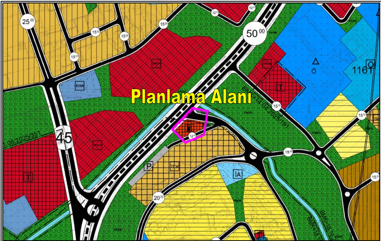
Resim 2: Planlama Alanlarının 1/5.000 Ölçekli Nazım İmar Planındaki Durumu

Planlama alanı; yürürlükte olan 1/5.000 ölçekli Nazım İmar Planında "Akaryakıt ve Servis İstasyon Alanı" olarak planlıdır. (Bkz. Resim 2)